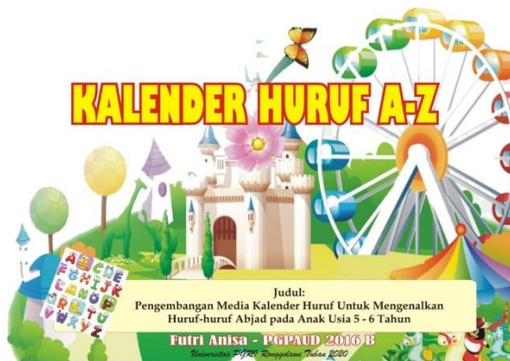
Gambar 2. Desain Kalender Huruf

Adapun model pembelajarannya sebagai berikut :