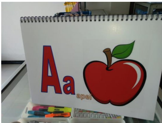
Gambar 3 Kartu huruf

Produk yang dihasilkan berupa kalender huruf seperti gambar diatas, Kalender huruf ini didesain dengan semenarik mungkin agar anak tertarik, Kalender huruf berisikan berbagai macam huruf dan gambar untuk dikenalkan pada anak usia dini dalam perkembangan kognitif kalender huruf didesain memiliki bentuk dan warna agar anak senang dan mudah memahami huruf.