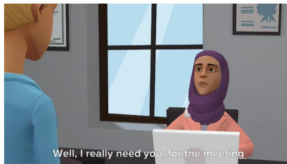
Gambar 1. Video animasi 3D yang disediakan oleh Dosen.

Tahap terakhir dari proses penerapan media ini adalah presentasi atau pemutaran video masing masing pasangan. Dosen dan teman teman lain memberikan masukan. Dalam proses ini banyak hal lucu terjadi. Ekspresi animasi kadang berlebihan dan aksesoris yang dipakai karakter juga sangat menarik sesuai imajinasi siswa. Dalam tahap ini Dosen dan mahasiswa memberikan masukan kepada teman yang sedang mempresentasikan video. Dalam tahap ini pula dilakukan penilaian Speaking yang meliputi Pronunciation, Fluency, Grammar, Intonation and Vocabulary . Sebagai contoh bisa dilihat di Gambar 1.