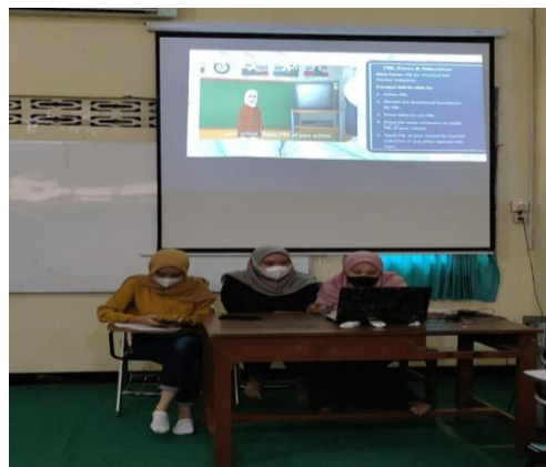
Gambar 2. Mahasiswa presentasi Video animasi 3D karya mereka.