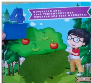
Gambar 3. Sesudah lift the flap dibuka