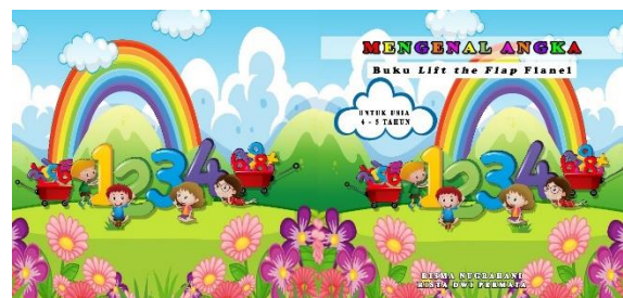
Gambar 1. Sampul depan dan belakang buku lift the flap

Desain produk pada media buku lift the flap seperti pada gambar berikut: