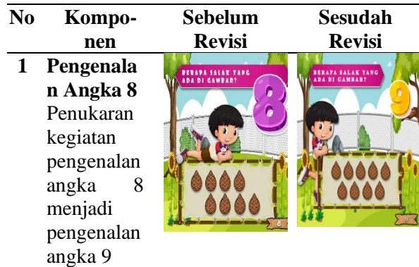
Tabel 5. Revisi Produk

Setelah melakukan uji coba terdapat beberapa revisi antara lain: