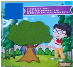
Gambar 2. Sebelum lift the flap dibuka

Berikut salah satu halaman pada media buku lift the flap .