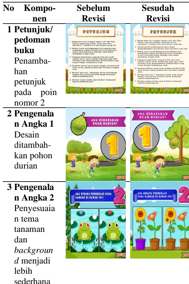
Tabel 3. Hasil Revisi Validasi

Revisi media buku lift the flap flanel untuk anak usia dini dilakukan setelah validasi ahli media dan ahli materi. Materi dan media dari buku lift the flap untuk anak usia dini direvisi sebagai tindak lanjut dari pengembangan media tersebut. Lift the flap pada gambar ada di tiap angka dan berbentuk geometri (contoh angka 1 ditutup dengan flanel yang berbentuk geometri, jika dibuka maka akan terlihat angka 1 nya). Gambar berikut berupa desain, belum dipasang lift the flap nya.