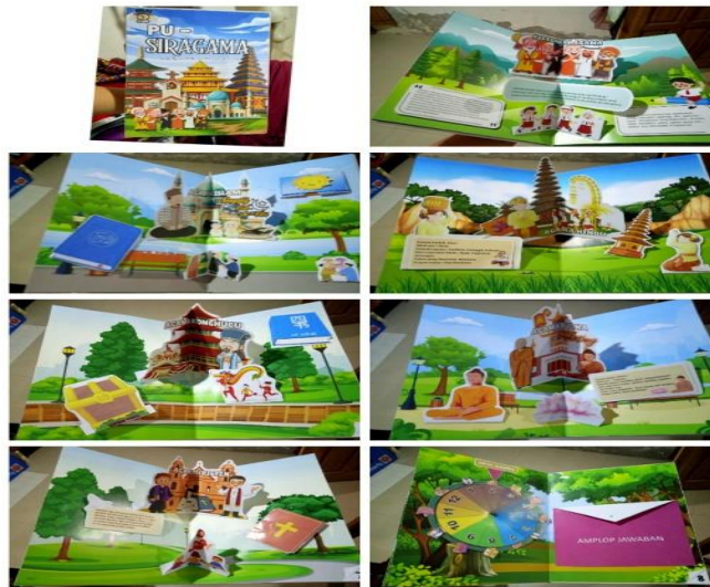
Gambar 1. Foto Media Pembelajaran PU-SIRAGAMA

Penelitian ini menghasilkan produk yaitu media PU-SIRAGAMA ( Pop-Up Book Simbol Keragaman Agama) dalam pembelajaran Pendidikan Pancasila pada siswa kelas II UPT SDN Doromukti. Penelitian dilakukan secara bertahap sesuai dengan tahapan pengembangan menggunakan metode ADDIE yakni, dimulai dari tahap analyze atau analisis, design atau perancangan, develop atau pengembangan, implement atau penerapan, serta evaluate atau evaluasi.