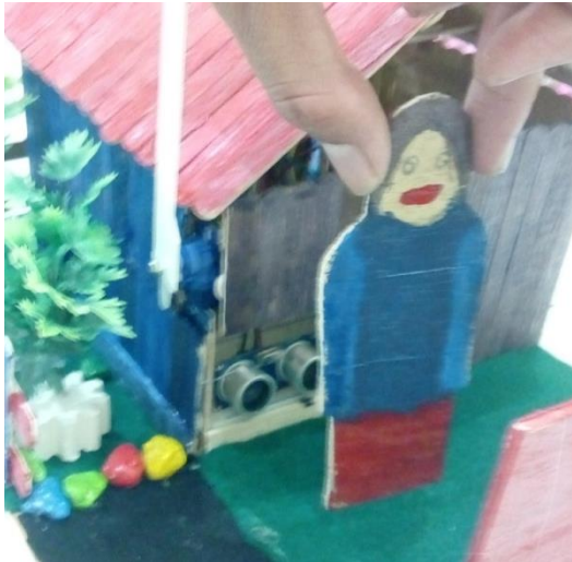
Gambar 13. Sensor Mendeteksi Penunjung yang Melewati Pintu Masuk