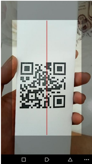
Gambar 8. Pemindaian QR Code pada Layar Smartphone