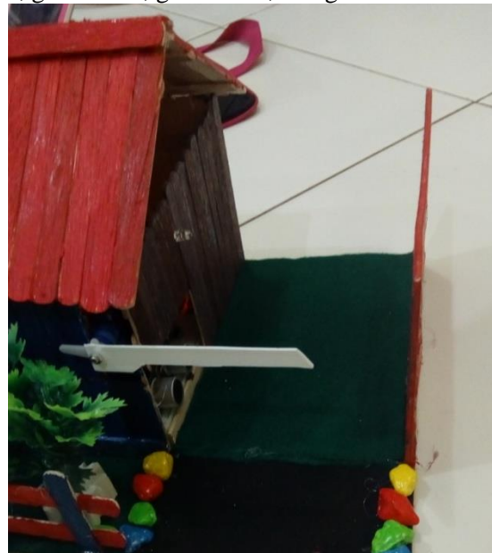
Gambar 11. Kondisi Pintu Masuk sebelum Mendapatkan Data Kuota Pengunjung

Data yang telah didapatkan dari proses scanning akan dikirimkan ke arduino pada paan pintu melalui port serial dengan media bluetooth. Setelah arduino pada palang pintu mendapatkan data kuota pengunjung, maka pintu akan terbuka. Kemudian sistem akan melakukan proses perhitungan pengunjung yang melewati pintu masuk. Pintu akan tertutup kembali setelah jumlah kuota terpenuhi. Adapun proses perhitungan pengunjung dapat dilihat pada gambar 10, gambar 11, gambar 12, dan gambar 13.