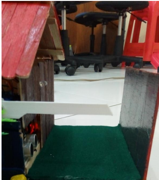
Gambar 12. Kondisi Pintu Masuk setelah Jumlah Kuota Pengunjung Terpenuhi