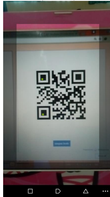
Gambar 6. Pemindaian QR Code pada Layar Laptop

Adapun tampilan dari proses scanning pada layar laptop, layar smartphone , dan kertas dapat dilihat pada ambar 6, ambar 7, ambar 8.