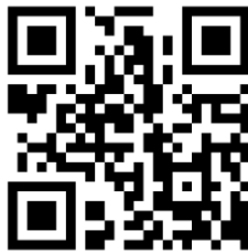
Gambar 4. QR Code

QR Code merupakan singkatan dari Quick Response Code, atau dapat diterjemahkan menjadi kode respon cepat. QR Code dikembangkan oleh Denso Corporation, sebuah perusahaan Jepang yang banyak bergerak di bidang otomotif. QR Code ini dipublikasikan pada tahun 1994 dengan tujuan untuk pelacakan kendaraan di bagian manufaktur dengan cepat dan mendapatkan respon dengan cepat pula (Griha & Isa, 2017).