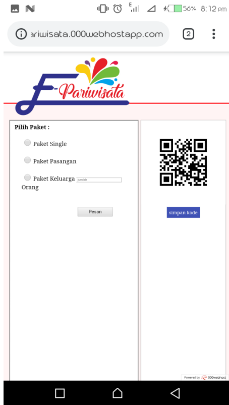
Gambar 5 Tampilan Pemesanan Tiket