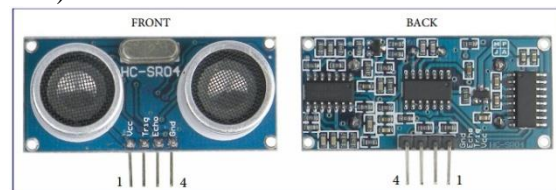
Gambar 3. Sensor Ultrasonic HC-SR04

Sensor Jarak Ultrasonik merupakan sensor yang digunakan untuk mengukur jarak sebuah benda dengan memanfaatkan sinyal suara ultrasonik. Sensor ini menghasilkan gelombang suara pada frekuensi tinggi yang kemudian dipancarkan oleh bagian emitter. Pantulan gelombang suara (echo) yang mengenai benda di depannya akan ditangkap oleh bagian receiver. Jarak benda yang ada di depan modul sensor tersebut didapatkan dengan cara mengetahui lama waktu antara dipancarkannya gelombang suara oleh emitter sampai ditangkap kembali oleh receiver. Salah satu jenis sensor ini adalah sensor HC-SR04. Jarak pengukuran yang dapat dilakukan oleh sensor ini adalah 2 sampai 500 sentimeter, dengan sudut efektif sebesar kurang dari 15 derajat. Gambar sensor jarak HC-SR 04 ditunjukkan pada gambar berikut (Magdalena, Greisye and Halim, Fransiscus Ati and Aribowo, 2013) .