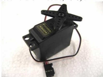
Gambar 2. Motor Servo

Motor servo adalah sebuah motor dengan sistem closed feedback di mana posisi dari motor akan diinformasikan kembali ke rangkaian kontrol yang ada di dalam motor servo. Motor ini terdiri dari sebuah motor, serangkaian gear, potensiometer dan rangkaian control . Ada dua jenis motor servo, yaitu motor servo standard dan motor servo continuous. Motor servo standard hanya mampu bergerak dua arah dengan masing-masing sudut mencapai 90 derajat. Sedangkan motor servo continuous mampu bergerak dua arah tanpa batasan sudut putar (Magdalena, Greisye and Halim, Fransiscus Ati and Aribowo, 2013) .