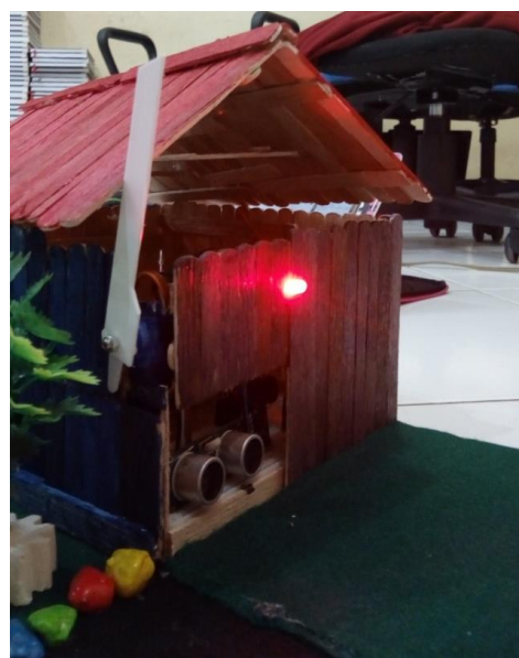
Gambar 12. Kondisi Pintu Masuk setelah Mendapatkan Data Kuota Pengunjung